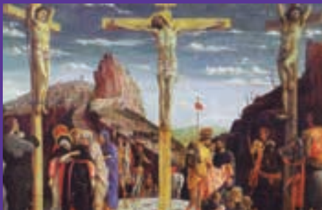
La Crucifixión - Andrea Mantegna

¿Por qué, Señor, que siendo Dios y hombre te dejaste colgar de ese madero y aguantas en silencio tanto tiempo la ingratitud del ser que a ti te debe el poder aplacar la sed ardiente del vacío e inquietud que siempre siente quien medita en el fin que hay tras la muerte?