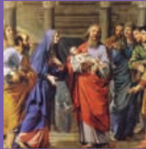
Presentación en el Templo: Philippe de Champaigne

las 12,30 horas, visita guiada al Museo de Tapices de La Seo y a las 14 horas, almuerzo de convivencia.