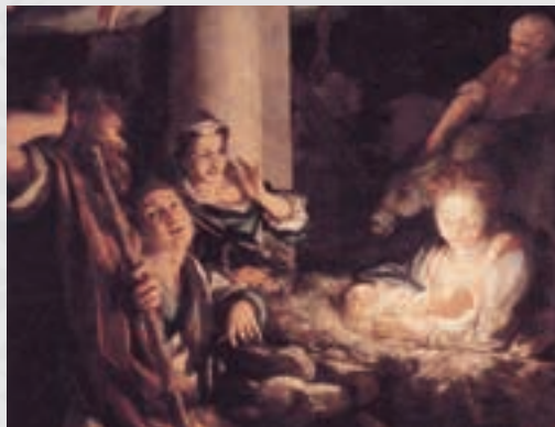
La adoración de los pastores - Correggio