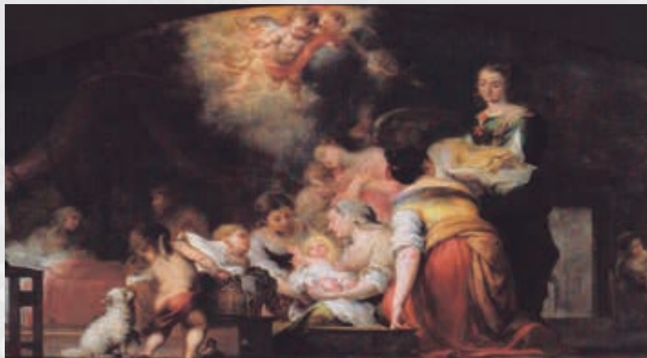
El nacimiento de la Virgen - Bartolomé Esteban Murillo