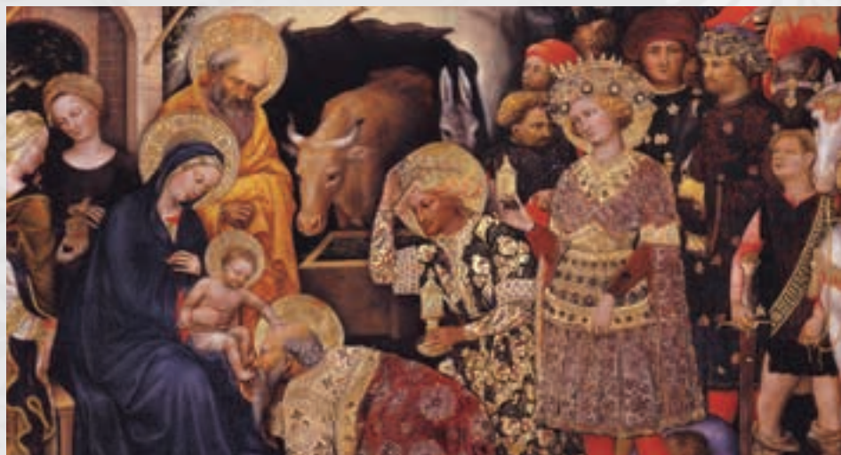
Adoración de los Reyes Magos - Gentile da Fabriano