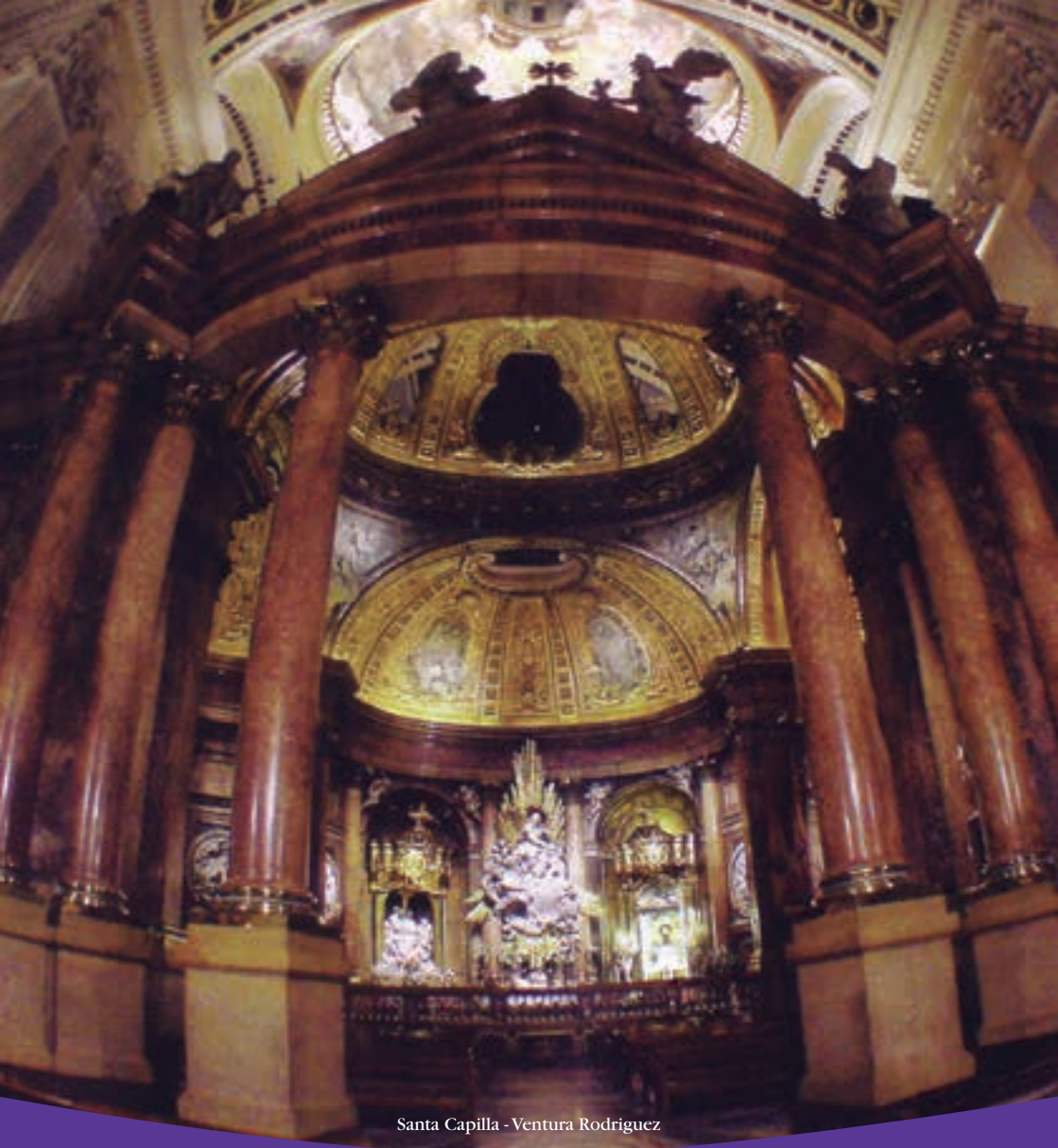
Santa Capilla - Ventura Rodriguez

BASÍLICA DE NTRA. SRA. DEL PILAR Plaza del Pilar, s/n - Tel. 976 200 594 Dirección Postal Pl. de La Seo, 6 (Casa de la Iglesia), Oficina 319 50001 ZARAGOZA - Tel. 976 394 800 ext. 254 cabalerosdelpilar@gmail.com www.cabalerosdelpilar.com